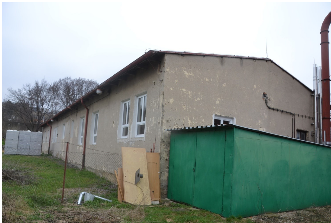
Obr 1: Budova dílen.