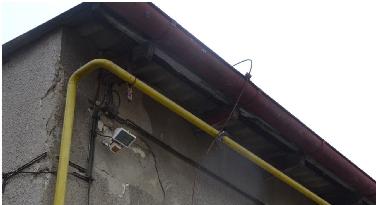
Obr 2: Detail okraje střechy.